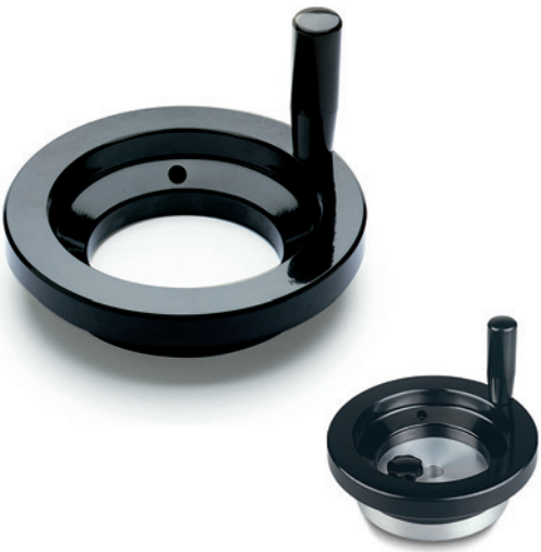
ELESA Original design

Volantino costituito da una corona con lobatura posteriore da fissare ad una flangia di metallo ricavata da laminato tondo. L'accoppiamento alla flangia è realizzato mediante una sede di centraggio (d2) e tre viti con testa cilindrica a cava esagonale.