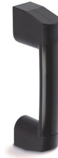
ELESA Original design