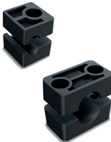
Corrispondenze tra il gruppo DIN 3015-1 e il gruppo DCE-S