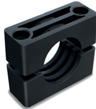
Corrispondenze tra il gruppo DIN 3015-2 e il gruppo DCE-H