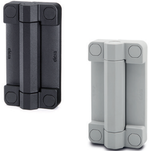
ELESA Original design

Max 180° (0° e +180° essendo lo 0° la condizione di complanarità delle superfici interconnesse). Evitare di oltrepassare l'angolo limite di rotazione per non compromettere le prestazioni meccaniche della cerniera. La complanarità deve essere rigorosamente verificata poiché la cerniera non deve essere sollecitata con angolazione negativa (fig.4). Per scegliere il tipo ed il numero di cerniere da utilizzare in ogni applicazione, consultare le Linee Guida (vedi Catalogo 166 pag. 952).