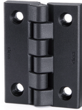
ELESA Original design

Per scegliere il tipo ed il numero di cerniere da utilizzare in ogni applicazione, consultare le Linee Guida (a pag. 1298).