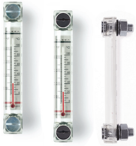
ELESA Original design

Dans tous les cas, il est conseillé de vérifier que les conditions réelles de fonctionnement soient convenables aux caractéristiques du produit.