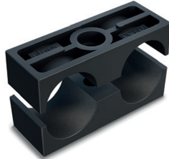
Referenz zwischen der DIN-3015-2-Gruppe und der DCE-H-Gruppe